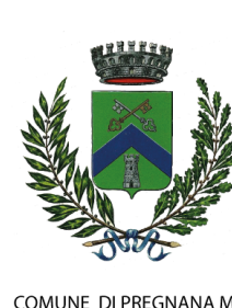
COMUNE DI PREGNANA M.SE