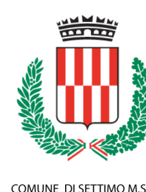
COMUNE DI SETTIMO M.SE