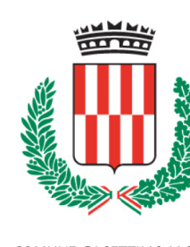
COMUNE DI SETTIMO M.SE