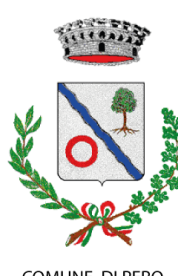
COMUNE DI PERO