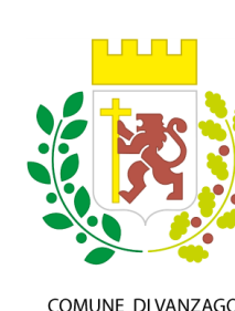
COMUNE DI VANZAGO