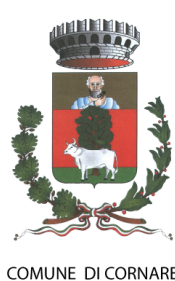
COMUNE DI CORNAREDO