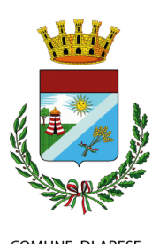
COMUNE DI ARESE

Dal lunedì al venerdì dalle 10.00 alle 12.00 martedì e giovedì anche il pomeriggio dalle 16.15 alle 18.15