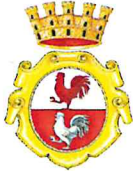
CITTA' DI GALLARATE